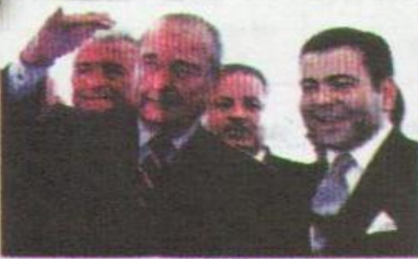
S.A.R. le Prince Moulay Rachid et le Président français Jacques Chirac visitent le port de Tanger-Méditerranée.